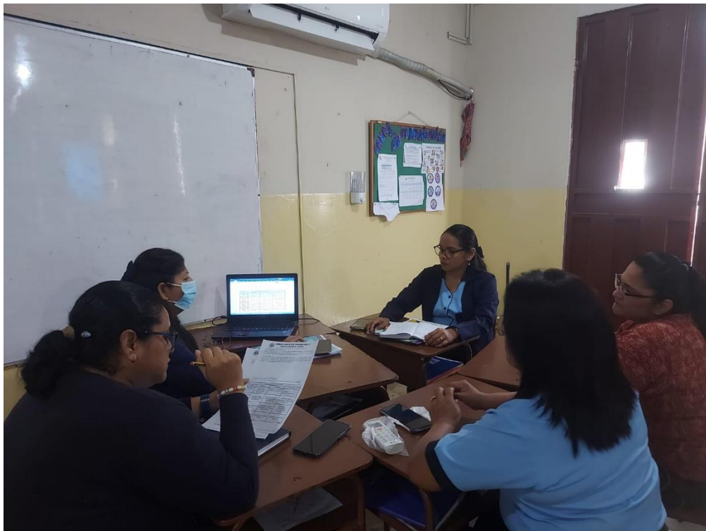
Personal Docente y Representante de la Iglesia Vida Nueva