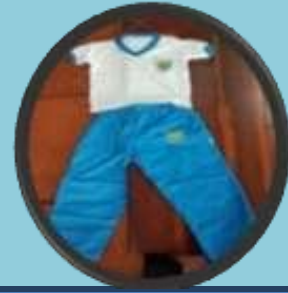
UNIFORME DE EDUCACIÓN FÍSICA