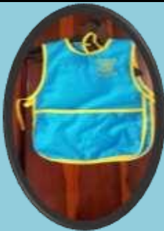
MANDIL EDUCACIÓN INICIAL