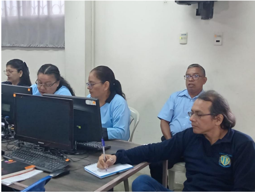
Personal Docente, de Sistemas y Servicios Varios