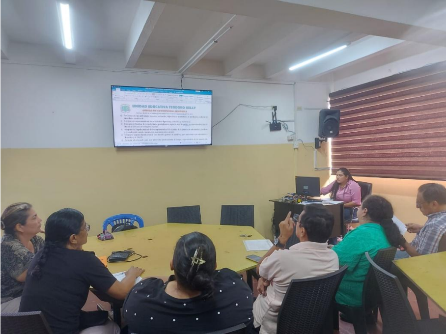
Padres de familia y comunidad